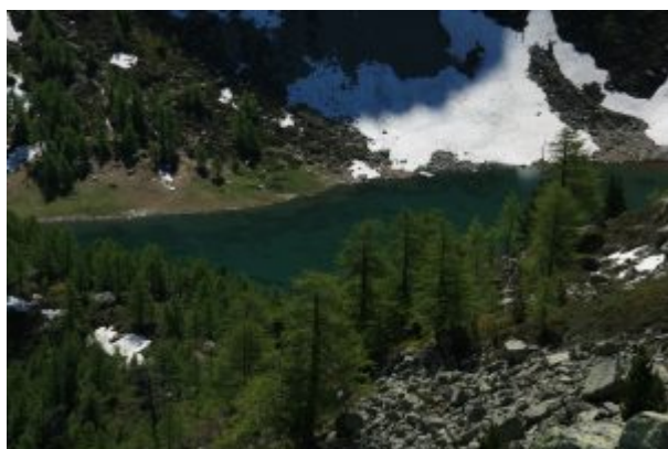
Lago d'Arpy visto dall'alto

e si trova una radura erbosa adatta per gruppi numerosi con alberi alle spalle. (Vista del lago salendo al Colle della Croce).