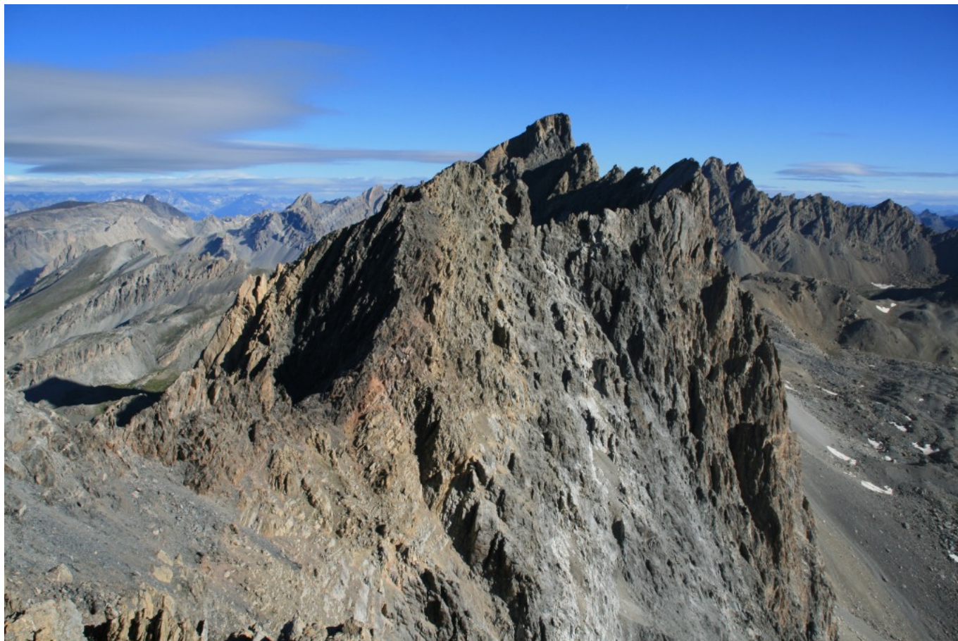
Dalla cima del Buc de Nubiera si vede il Brec de Chambeyron