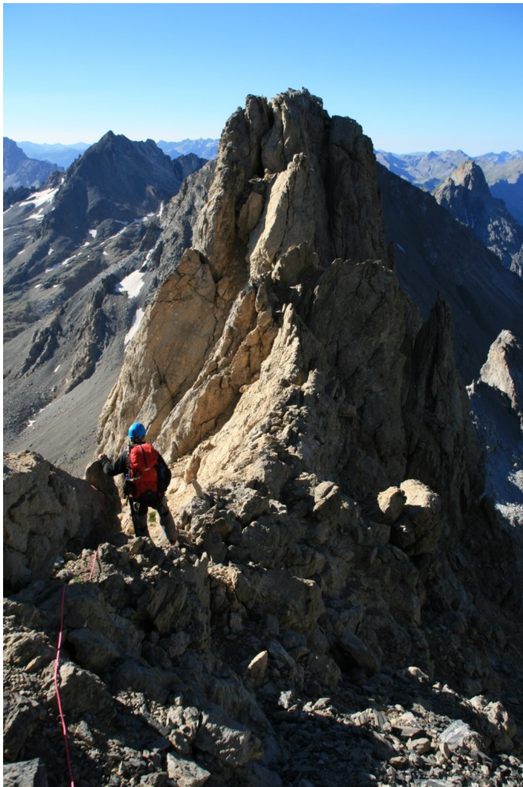
Foto del tratto in discesa dal Buc de Nubiera