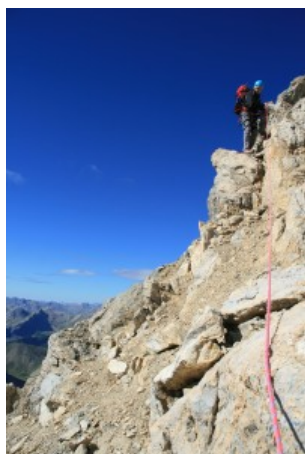
Rocce e pietrisco

Discesa per la cresta sud. La cresta non è difficile, ma dopo la prima parte è più complessa sia per l'individuazione del giusto tracciato sia per la qualità della roccia.