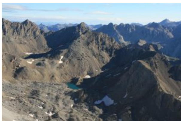
Lago del Vallonasso e Tete de la Frema