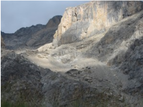
Canale di sfasciumi

Poi si abbandona il sentiero e si imbecca un evidente e ripido canale di sfasciumi (faticoso) posto sul versante ovest del Buc de Nubiera con una salita in diagonale.