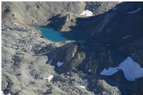
Lago del Vallonasso, vicino al Bivacco Barenghi

Discesa per la cresta sud. La cresta non è difficile, ma dopo la prima parte è più complessa sia per l'individuazione del giusto tracciato sia per la qualità della roccia.