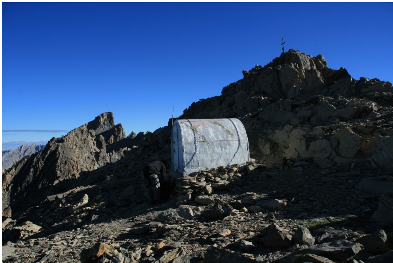
Bivacco Montaldo sotto la cima del Buc de Nubiera

Il Bivacco Montaldo per la sua posizione, situato nei pressi della vetta del Buc de Nubiera, è unico! La cresta parte dal Col de Nubiera e conduce al Brec de Chambeyron, 3389 m, sul confine italo-francese, tra la Val Maira e la Valle dell'Ubaye. La difficoltà fino al bivacco: F, il tempo di salita di 4 ore. Il bivacco della Giovane Montagna ha la capienza di 4 posti, stretti, due comodi. Attrezzatura essenziale di materassi e coperte. Attenzione: non vi è acqua negli immediati dintorni.