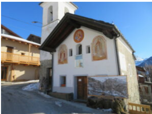
Chiesa a Mandriou