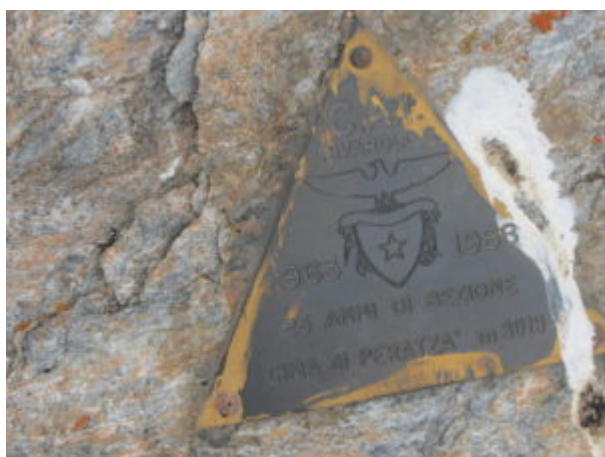
Targa del CAI di Rivarolo alla Cima di Peradzà

Si raggiunge poi la Cima di Peradzà, sulla sommità c'è una targa del CAI di Rivarolo.