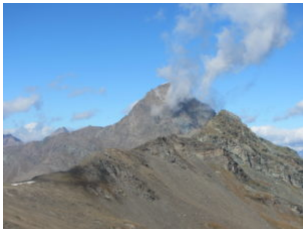
Cresta percorsa dal Bec Costazza

Si incontra un evidente accumulo di rocce stratificate, un evidente segnale.