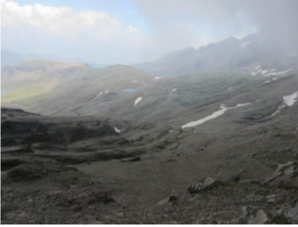
Il vallone che si attraversa