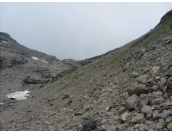
Guardando indietro: tratto più ripido di discesa

si percorre un “anfiteatro” dominato dalla Rosa dei Banchi o Roèse di Bantse, passando vicino al Lac Gelé e superata la traccia 7 si raggiunge la traccia 6C che si segue.