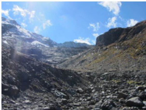
Uno sguardo al percorso fatto