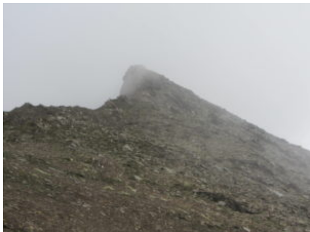
Cima di Peradzà o Pointe de Peradza

Si raggiunge poi la Cima di Peradzà, sulla sommità c'è una targa del CAI di Rivarolo.