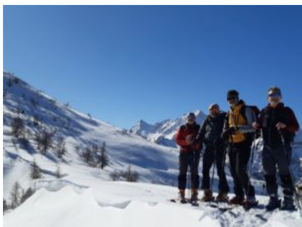
Cima del Clot

Dalla cima del Clot della Soma, volendo, è possibile proseguire verso il Colle del Pis (2610 m) e il Monte Morefreddo (2770 m).