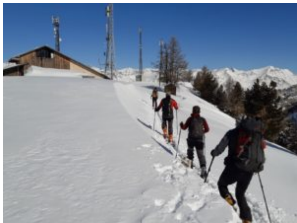
Arrivo della seggiovia del Clot

Dalla cima del Clot della Soma, volendo, è possibile proseguire verso il Colle del Pis (2610 m) e il Monte Morefreddo (2770 m).