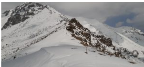
Colle della Roussa

Il panorama che si apre è vasto su entrambi i versanti.