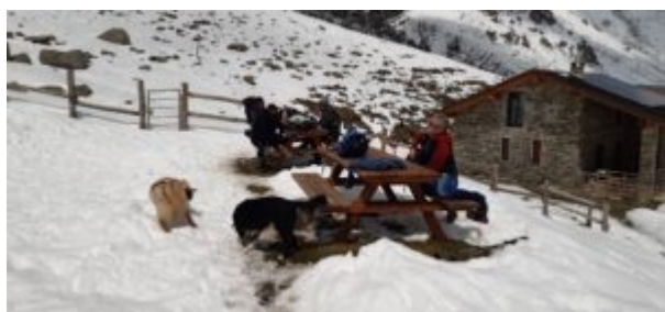
Rifugio Fontana Mura

Dopo 30-45 minuti di cammino si raggiunge il Rifugio Fontana Mura. (1h45-2h30 dall'auto)