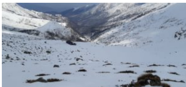
Il rifugio visto dall'alto

Il colle si presenta come una larga depressione con al centro un'edicola dedicata alla Madonna.