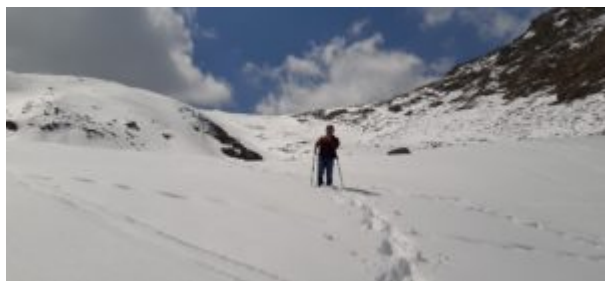
Traccia che porta al colle, poco dopo il rifugio

Il sentiero riprende dopo il rifugio e punta verso il colle che si raggiunge in 45' circa di cammino.