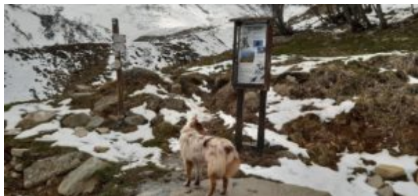
Inizio del sentiero dal tornante della strada

Dopo 30-45 minuti di cammino si raggiunge il Rifugio Fontana Mura. (1h45-2h30 dall'auto)