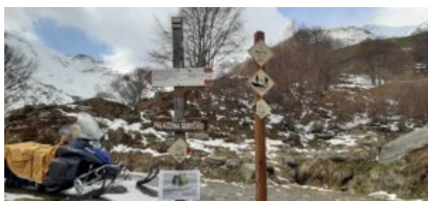
Deviazione verso la palazzina Sertorio

All'uscita del bosco si lascia a sinistra il sentiero per la palazzina Sertorio, e si prosegue sempre sulla carrareccia per qualche centinaio di metri.