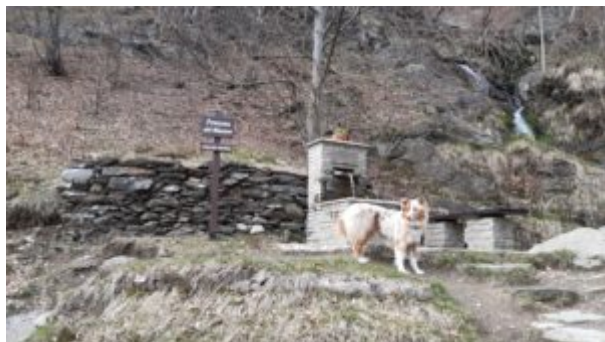
Fontana in pietra

e poco più avanti una croce infissa in un masso.