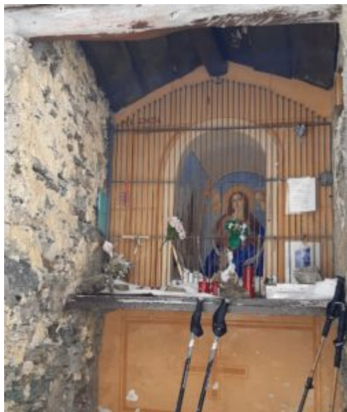
Edicola posta sul colle

Il panorama che si apre è vasto su entrambi i versanti.