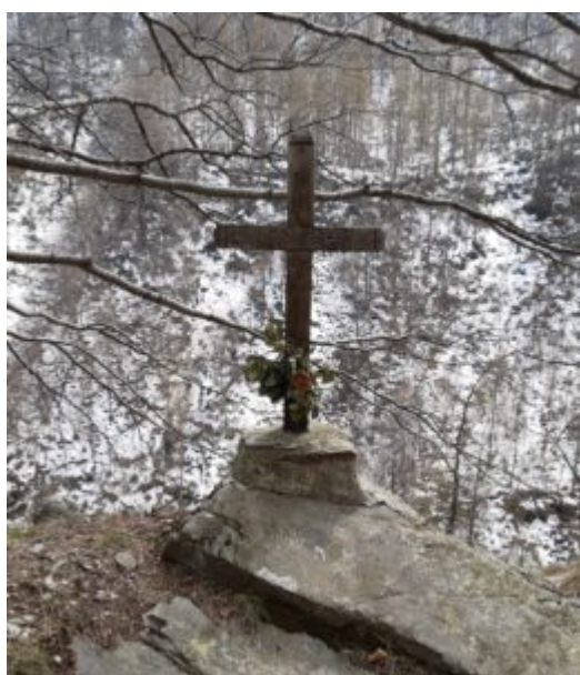
Croce infissa in un masso

e poco più avanti una croce infissa in un masso.