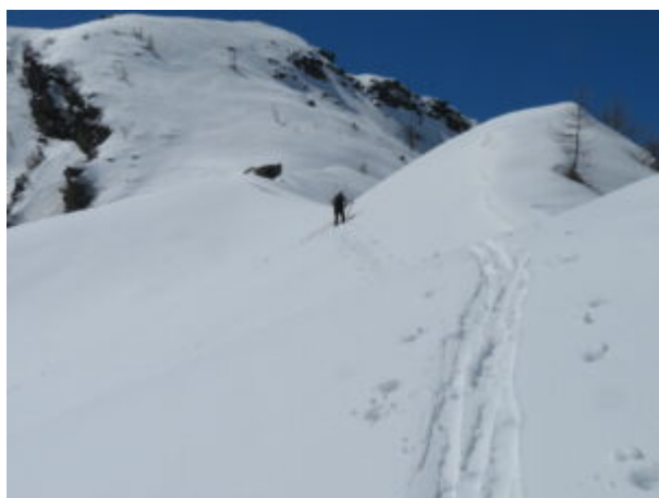
Verso lo Spallone Nord della Gran Roccia

Verso lo Spallone Nord, nell'ultimo tratto c'era una frattura nel manto nevoso e ci siamo fermati poco prima.