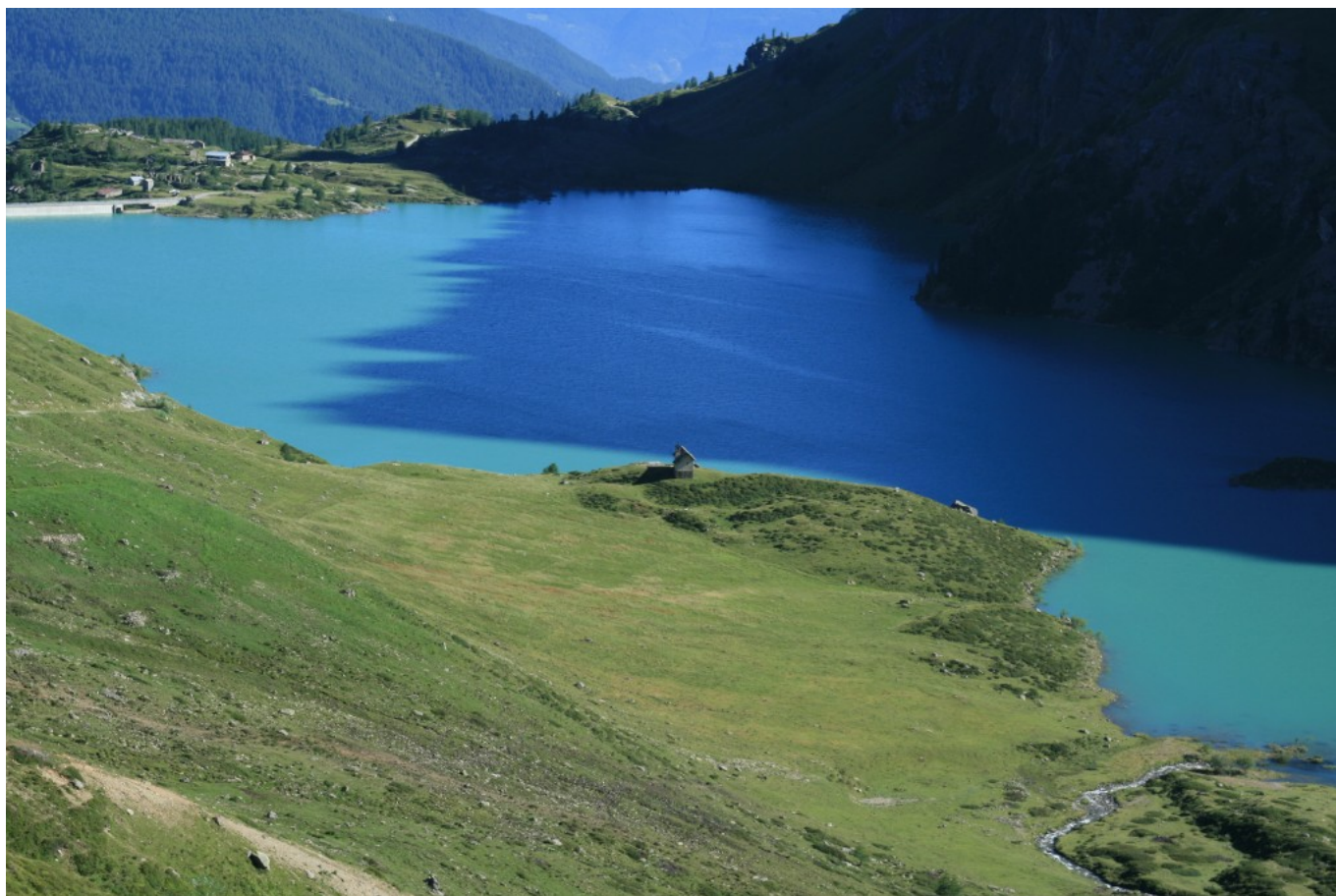
Lago di Cignana

Dal colle si può scendere in 30 minuti circa al Lago di Cignana (2157 m) dove si trova una bella chiesetta e ci sono ampi spazi per fermarsi.