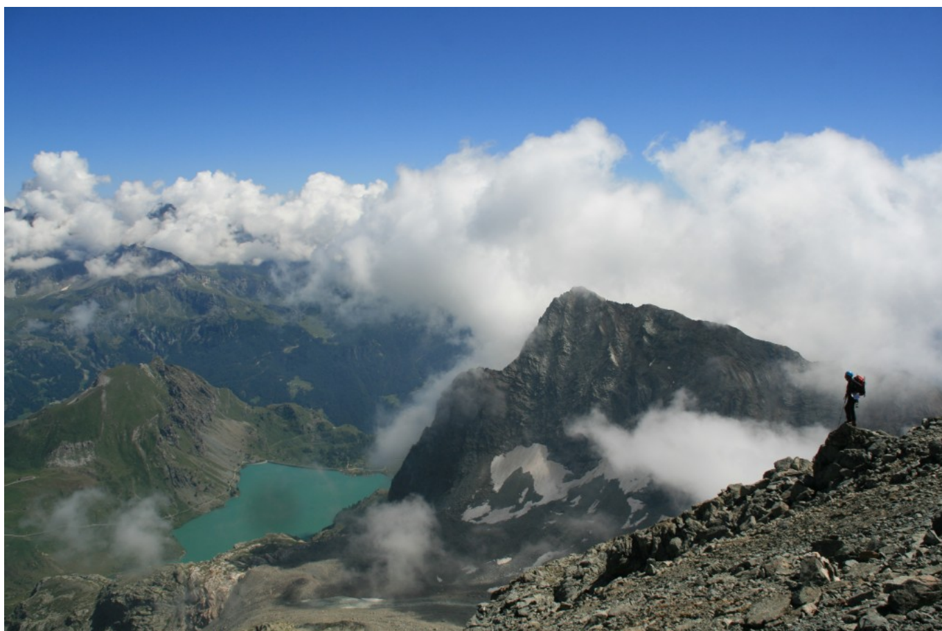
Lago visto dalla costiera di Balanselmo

Dall'altra parte del lago (verso valle) c'è il Rifugio Barmasse, ci vogliono 20 minuti circa per raggiungerlo (altro rifugio in zona è il Perucca, vedi gita su questo sito) e da lì si sale al Colle di Valcornera ed alle Punte di Valcornera.