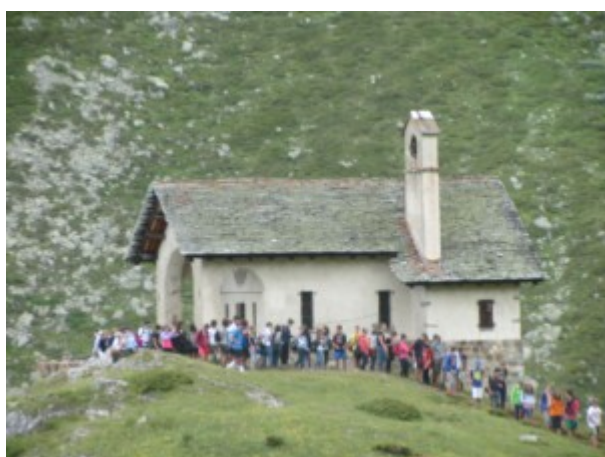
Chiesa in prossimità del lago

Dal colle si può scendere in 30 minuti circa al Lago di Cignana (2157 m) dove si trova una bella chiesetta e ci sono ampi spazi per fermarsi.