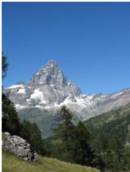
Sua maestà il Cervino

Lungo il percorso si possono ammirare bellissime aperture sul signore della valle: il Cervino. Per un tratto non lungo il sentiero passa su una dorsale molto inclinata (prestare attenzione, in particolare al ritorno)