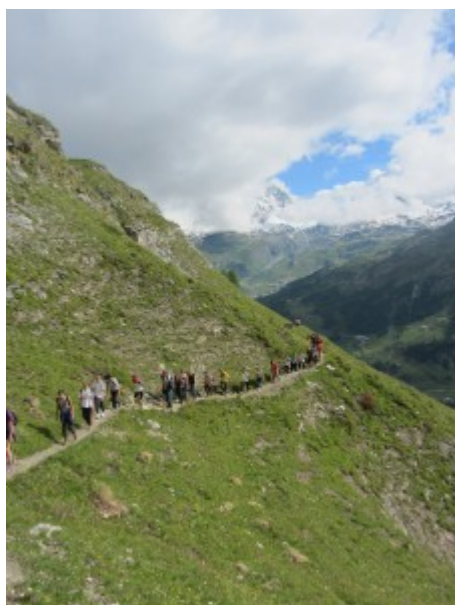
Si aggira la costiera

Lungo il percorso si possono ammirare bellissime aperture sul signore della valle: il Cervino. Per un tratto non lungo il sentiero passa su una dorsale molto inclinata (prestare attenzione, in particolare al ritorno)