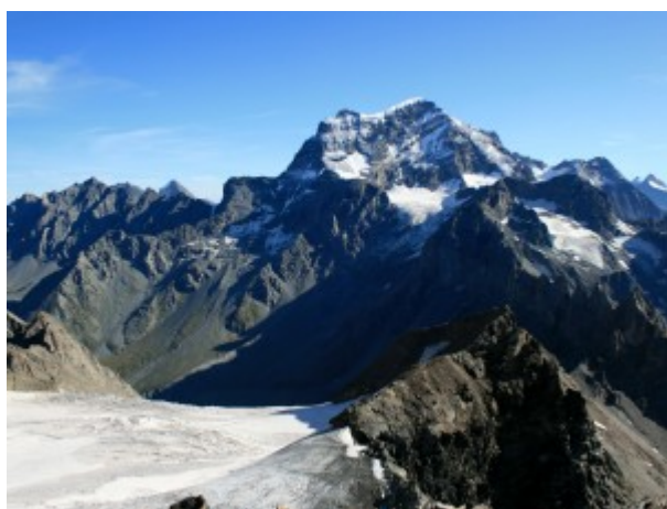
Grand Combin visto dal Vélán

Materiale da alpinismo classico: corda, ramponi, piccozza, casco.