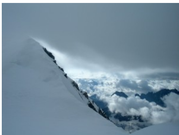
Cresta che sale al Grand Combin de Grafeneire