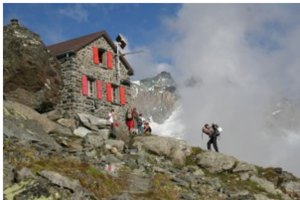
Arrivo alla Cabane de Valsorey

Il percorso continua a mezzacosta (destra idrografica della vallata). Si supera un piccolo ponte ed a un seguente bivio si tiene la sinistra, tralasciando la deviazione per la Cabane du Velan. Successivamente si raggiungono delle grange e si risale il pendio posto sulla sinistra. quindi ad un bel pianoro, apertura sul Glacier de Valsorey. Poi sempre seguendo il sentiero si devia a sinistra, un pianoro sassoso precede il tratto finale, erto che porta alla Cabane de Valsorey.