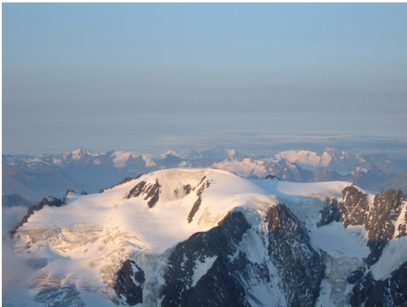
Cima del Vélan