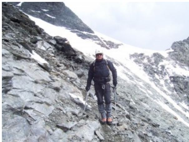
Scendendo dal Combin di Valsorey