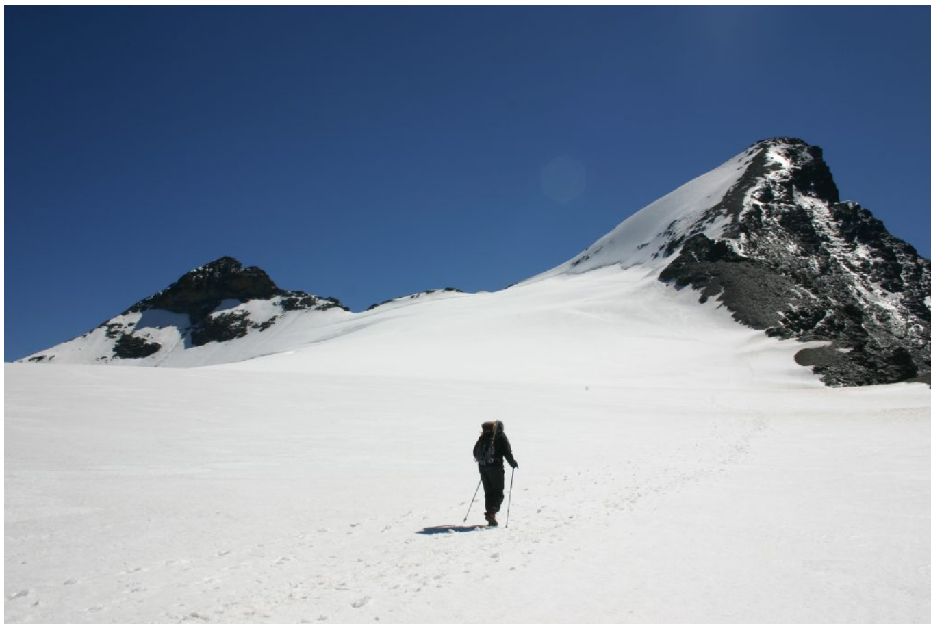
Sul ghiacciaio prima dell'erta finale

Nell'ultimo tratto la cresta si impenna decisamente e il sentiero si fa via via più ripido fino in vetta. Nel nostro caso, presenza di neve ghiacciata, abbiamo usato la piccozza nella salita.