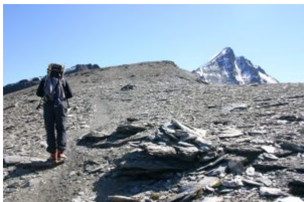
La cresta spiana

Successivamente la cresta spiana e la si segue integralmente fino ad una larga depressione intorno a quota 3100.