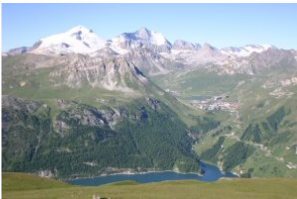
Panorama con il Lac du Chevrit

Dopo la salita tra i prati si giunge alla zona rocciosa, c'è un primo salto, e quindi sempre su sentiero con ometti. Bella apertura sul Mont Pourri.