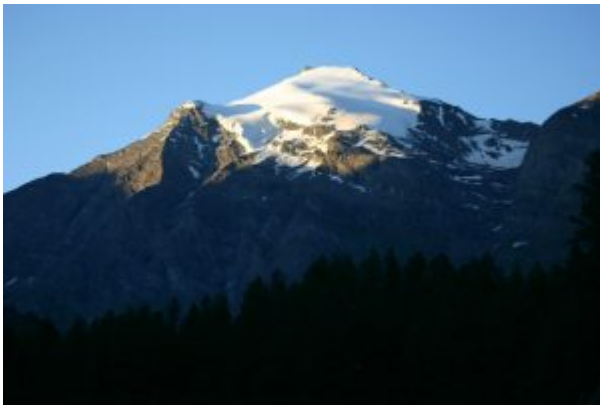
Pointe de Charbonnel

Dopo Isère si imbecca sulla destra una stradina asfaltata che conduce a Saut dove si parcheggia.