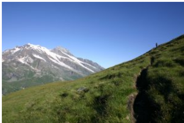
Salendo con il Mont Pourri sulla sinistra

Successivamente la cresta spiana e la si segue integralmente fino ad una larga depressione intorno a quota 3100.