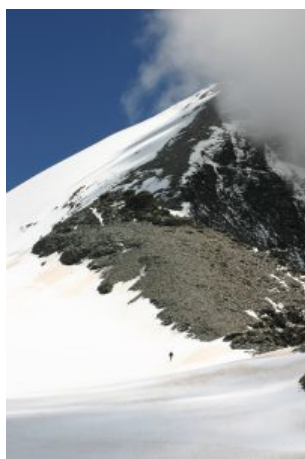
Scendendo la Grande Sassière

L'itinerario in discesa è lo stesso. Noi abbiamo usato i ramponi e la piccozza facendo un buon tratto sui bordi del ghiacciaio.