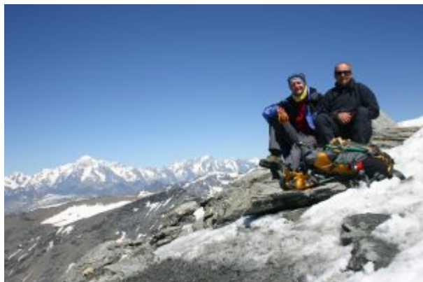
Sulla cima della Grande Sassière

Panorama indimenticabile vista che spazia dal Monte Bianco,