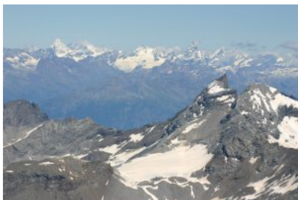
Grand Combin e Cervino