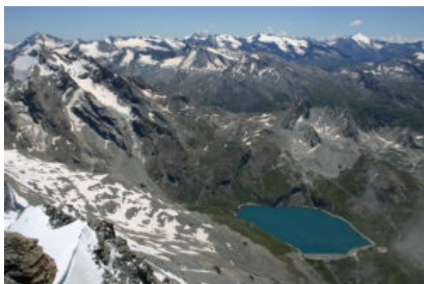
Verso il fondo valle, Lago di Tignes

La Grande Sassière è isolata e la visuale è a 360 gradi.