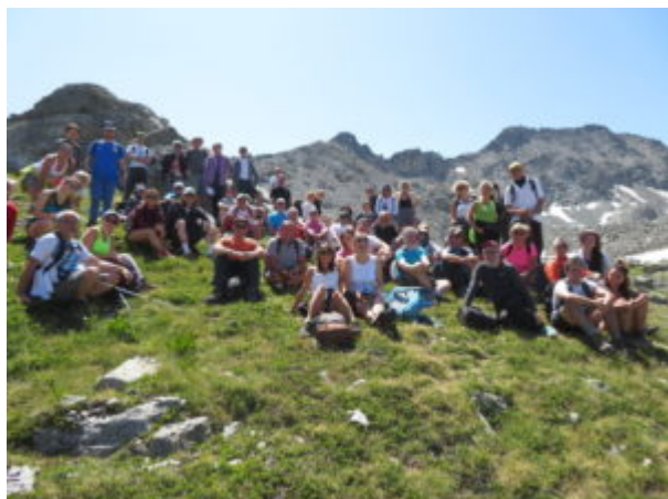
Gruppo di Torino al punto panoramico

Poco prima del lago, vicino ad un roccione, c'è un bel punto panoramico sulla Catena del Monte Bianco.