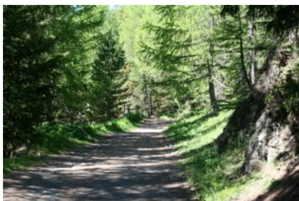
Carrareccia nel bosco

Si imbocca sul lato opposto all'hotel la strada sterrata segnalata con il n. 15 che sale in mezzo al bosco misto di abeti e larici, in moderata pendenza. Fino al lago il percorso è turistico.