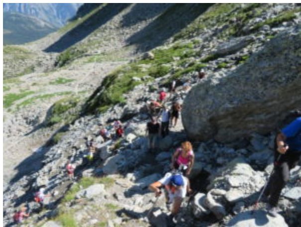
Salita più impegnativa

Più avanti si sale verso destra e poi verso sinistra per raggiungere l'attacco dell'ultimo tratto che ci separa dal lago. (In questa zona nella prima parte della stagione estiva si può trovare neve).