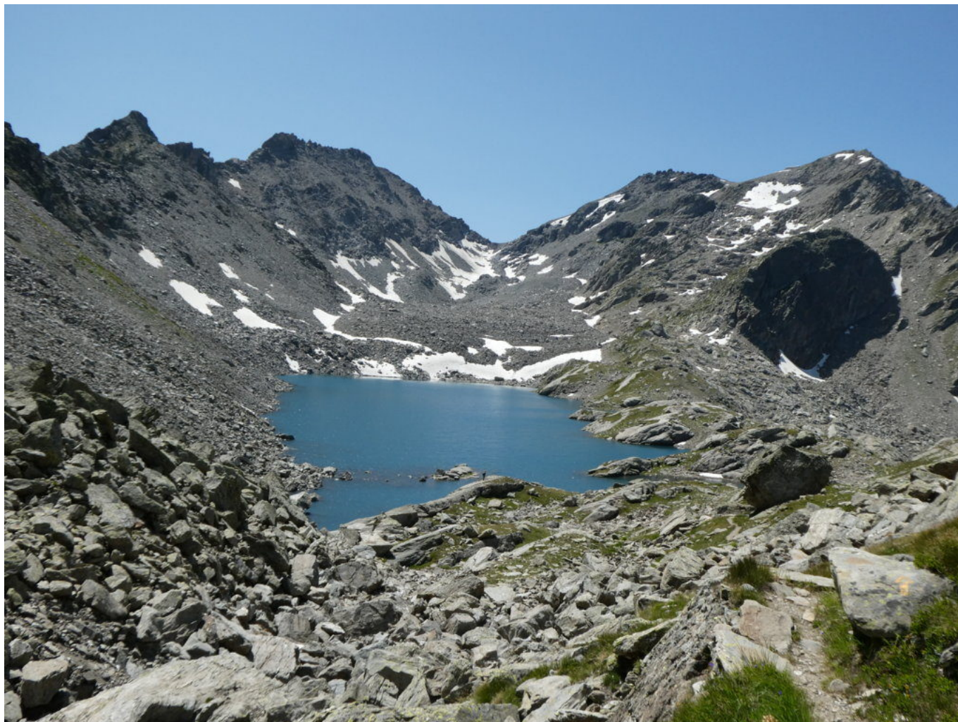
Lago di Pietra Rossa visto dal sentiero che sale verso il Passo d'Ameran

Materiali: normale dotazione escursionistica.