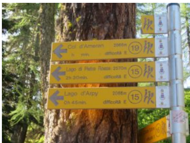
Indicazioni per il percorso

A un certo punto si trova un cartello segnaletico: tenere la sinistra, mentre a destra si va verso il Colle della Croce.