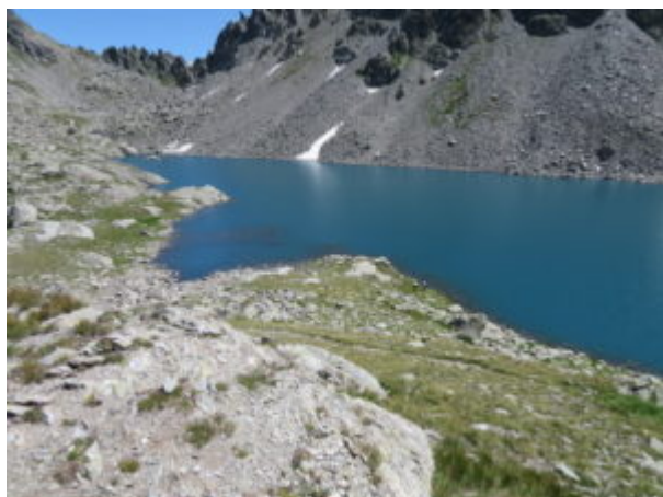
Lago di Pietra Rossa

Poco dopo aver scollinato si arriva al bel Lago di Pietra Rossa.