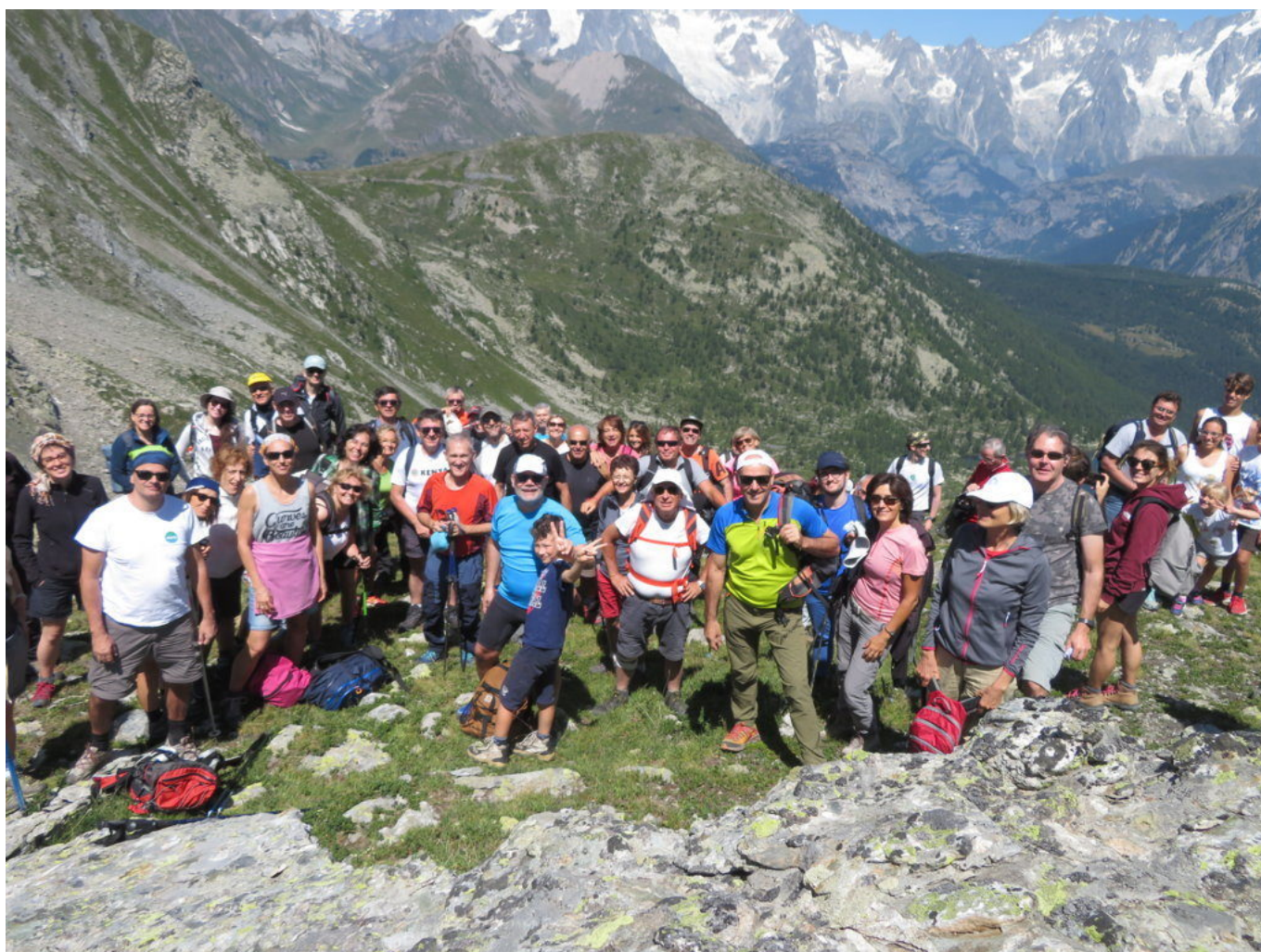
Il nostro gruppo al Lago di Pietra Rossa

Una inquadratura di gruppo con magnifico sfondo!