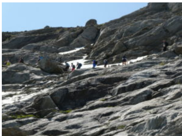
La parte finale dell'ascensione

Più avanti si sale verso destra e poi verso sinistra per raggiungere l'attacco dell'ultimo tratto che ci separa dal lago. (In questa zona nella prima parte della stagione estiva si può trovare neve).