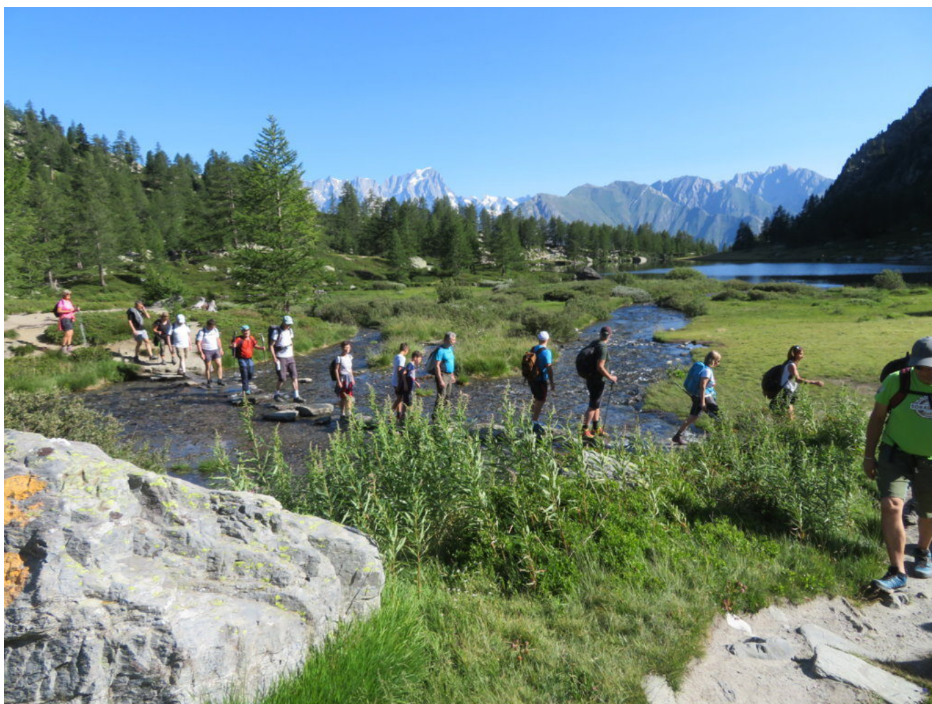
Si supera il Torrente d'Arpy

Quindi si supera il Torrente d'Arpy su un camminamento di pietre e si passa sul lato orografico destro del vallone.