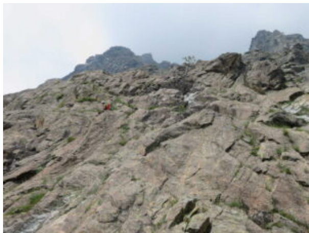
L8: tiro verticale sopra la sosta su liscia roccia. 5b+. (Possibile variante d'uscita a sinistra. 4c).