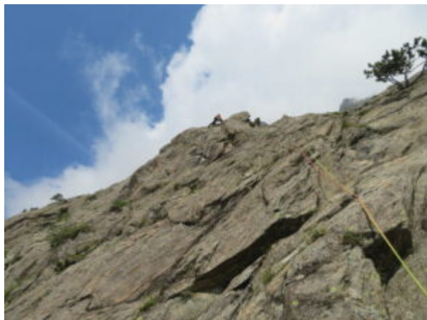
Via di arrampicata Mahsa

L5: si sale sul terrazzino superiore, quindi una breve placca fessurata che porta alla base di un liscio muro verticale (tratto di "Fantasia" che dalla sosta prosegue poi a destra). 3a.