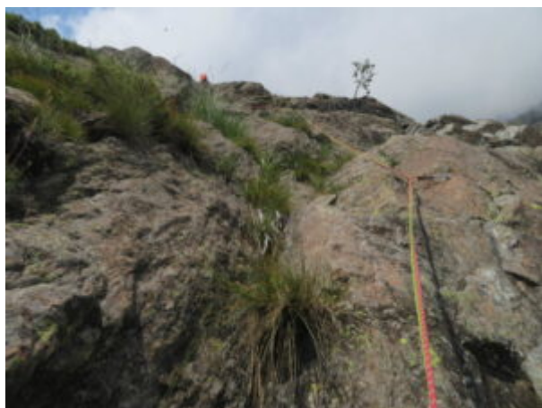
Qui finisce la prima parte della via. La seconda parte è stata attrezzata nel 2023.