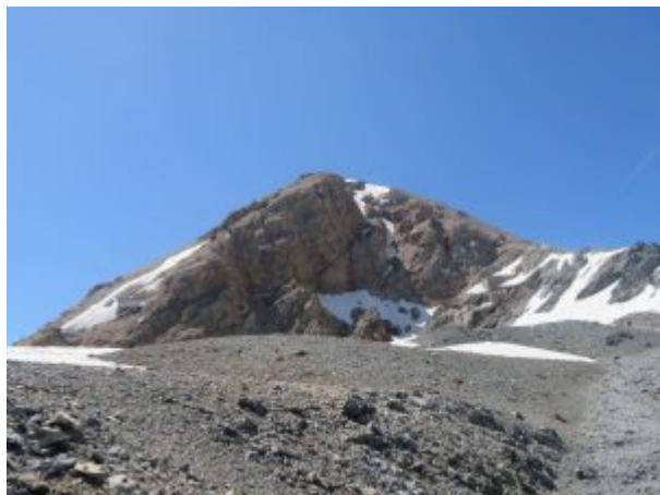
Cima del Monte Chaberton