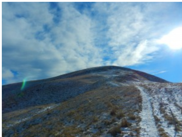
Salendo dal Colle di Malaura verso il Monte Ricordone

che si raggiunge su comodo sentiero fino alla sommità (palina con stazione meteo ARPA). Poco più in basso un'alta croce metallica ricorda il distacco della valanga che nel 1885 distrusse tre frazioni di Frassino.