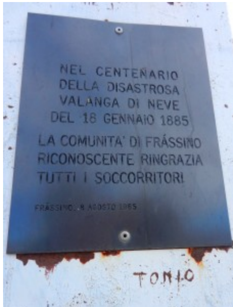
In ricordo della valanga del 1885