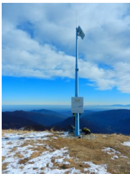
Palina con Stazione Meteo ARPA

che si raggiunge su comodo sentiero fino alla sommità (palina con stazione meteo ARPA). Poco più in basso un'alta croce metallica ricorda il distacco della valanga che nel 1885 distrusse tre frazioni di Frassino.