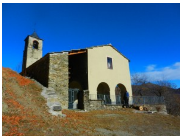
Pieve della borgata Ricchetta

Il sentiero parte nella parte bassa dell'abitato, in direzione ovest, e rimonta i boschi con modesta risalita fino a raggiungere il Colle Malaura.