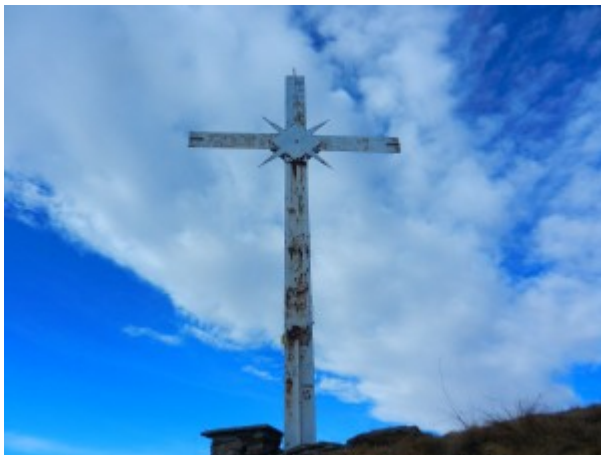
Poco sotto la cima, la Croce