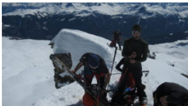
Sci sul sacco e si scende lungo scala

Qui si scende da una breve (10 m) ma ripida e completamente verticale scaletta metallica che permette di superare un salto di rocce e giungere a una sella.