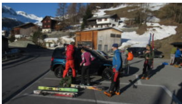
Parcheggio di Mathon