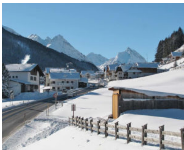
Entrata nel paese di Mathon