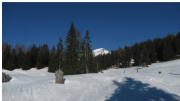
Entrata nel lariceto

Si risalgono i bei pendii soprastanti attraverso una serie di radure di abeti rossi e larici e poi, con direzione nord-ovest, si taglia ancora per un rado boschetto e si raggiunge l'alpeggio di Tgoms, posto a 1932 m, con diverse baite sparse sugli ampi e bellissimi pendii prativi.