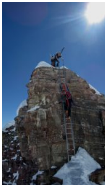
Attenzione alla fine della scala (ghiaccio!)