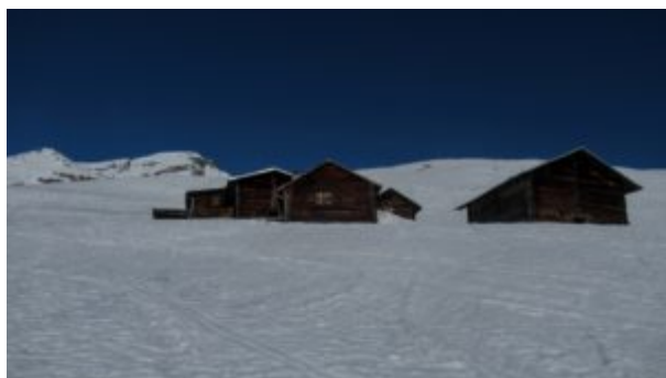
Alpeggio di Tgoms