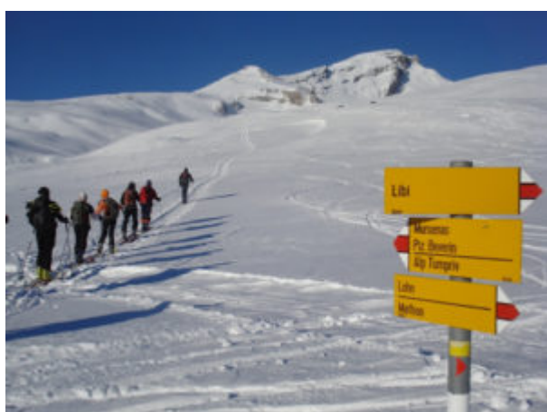
Verso quota 2159 m

Spostandosi più a sinistra, si sale prima su dolci pendenze e poi con un lungo falsopiano si costeggia il torrente della Val Mirer. Giunti in prossimità della base del Beverin Pingt a circa 2000 m, si attraversa il torrente e dopo un altro breve tratto semipianeggiante, con direzione ovest e poi nord-ovest, si sale