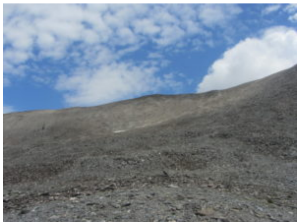
Colle di Malacosta

Più avanti si vede bene il Colle di Malacosta, l'ultimo tratto del sentiero taglia l'erta da sinistra verso destra.