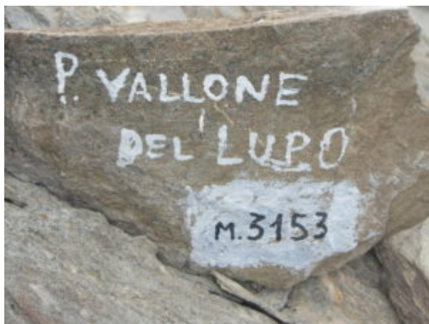
Sulla Punta del Vallone del Lupo

Bel panorama verso la Valle Maira dalla Punta del Vallone del Lupo.