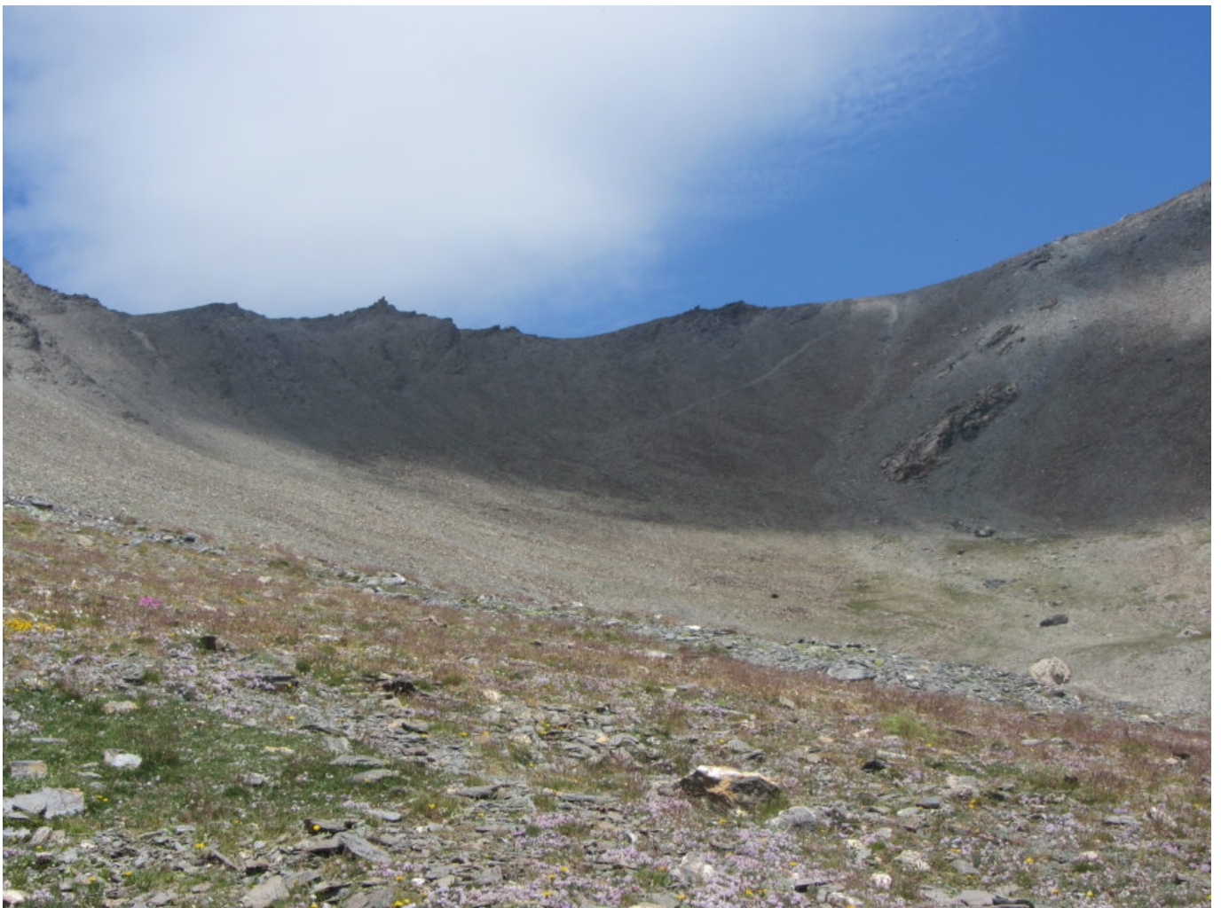
Verso il Colle di Malacosta

Lungo il percorso sono presenti numerosi ometti, dopo la salita decisa il sentiero spiana e si allarga la visuale.