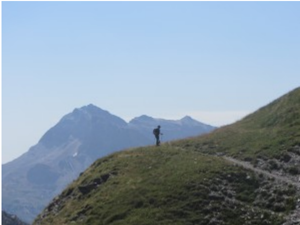
Salendo al Colle di Malacosta

Se nella seconda deviazione si sbaglia e si va dritti si giunge a un piccolo rio e allora bisogna risalire l'erta dorsale erbosa verso sinistra.