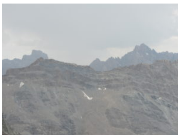
Brec e Aiguille de Chambeyron

Bel panorama verso la Valle Maira dalla Punta del Vallone del Lupo.