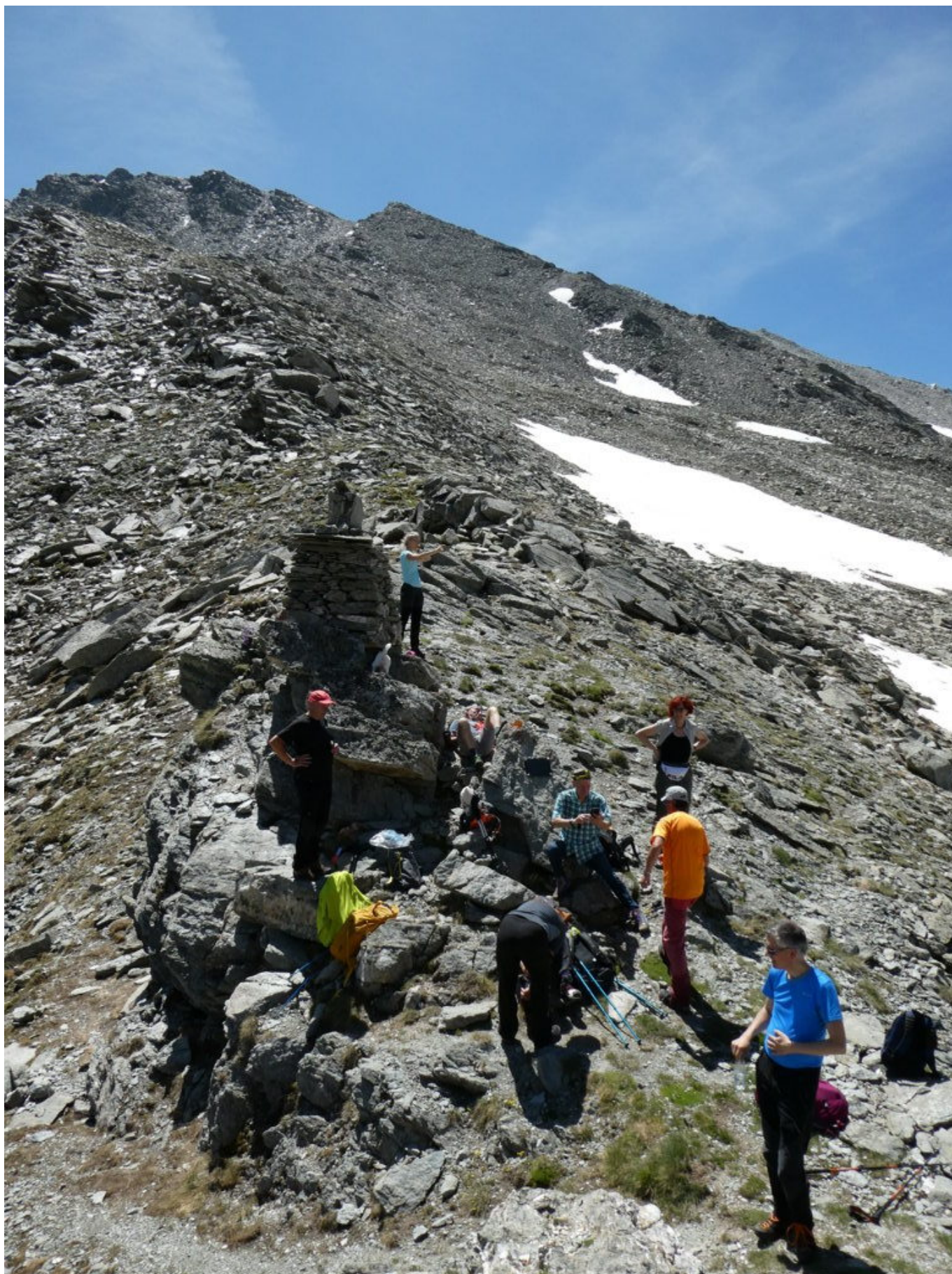
Il primo gruppo al Passo di Fiutrusa

caratterizzato da un grande segnale di pietrame. Sulla balza destra del colle la targa dedicata a don