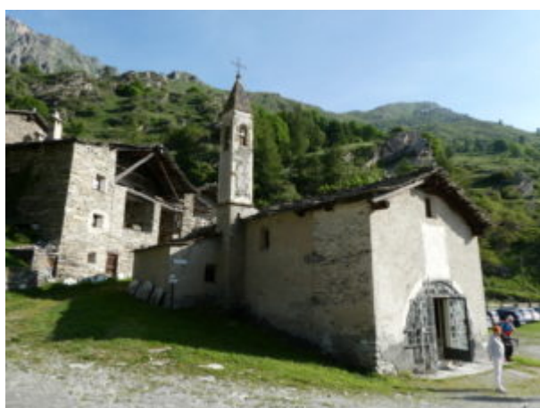
Chiesa di Sant'Anna

Dalla chiesa di Sant'Anna si risale seguendo prima la strada, poi superando il ponte ancora la strada e poi svolta a destra