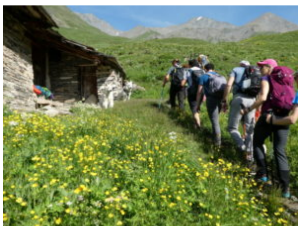
Salendo in gruppo

poi ci si inoltra in un suggestivo fondovalle di pascoli e grange.