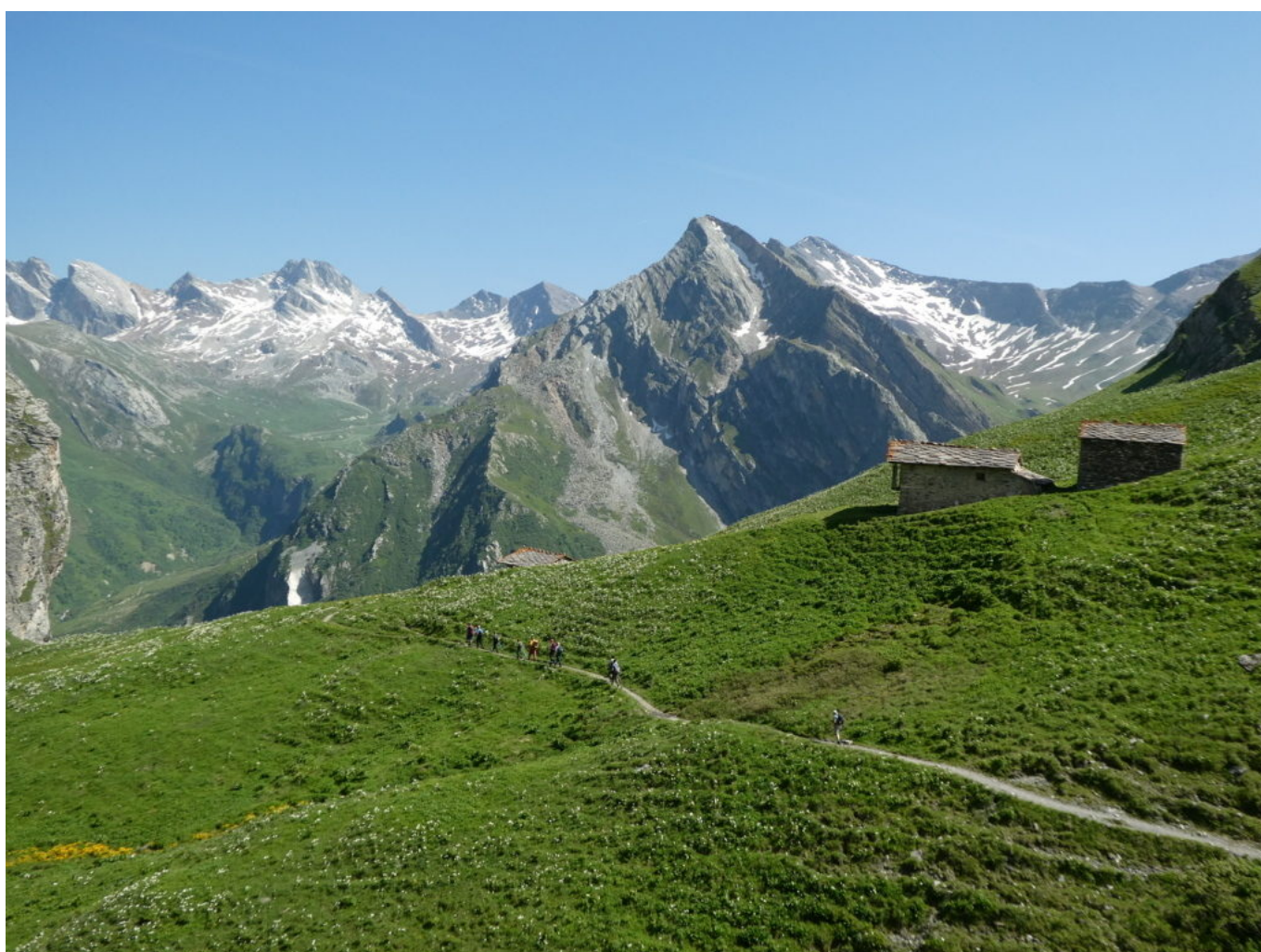
Panorama spettacolare scendendo dal Passo di Fiutrusa

Materiali: normale dotazione escursionistica.