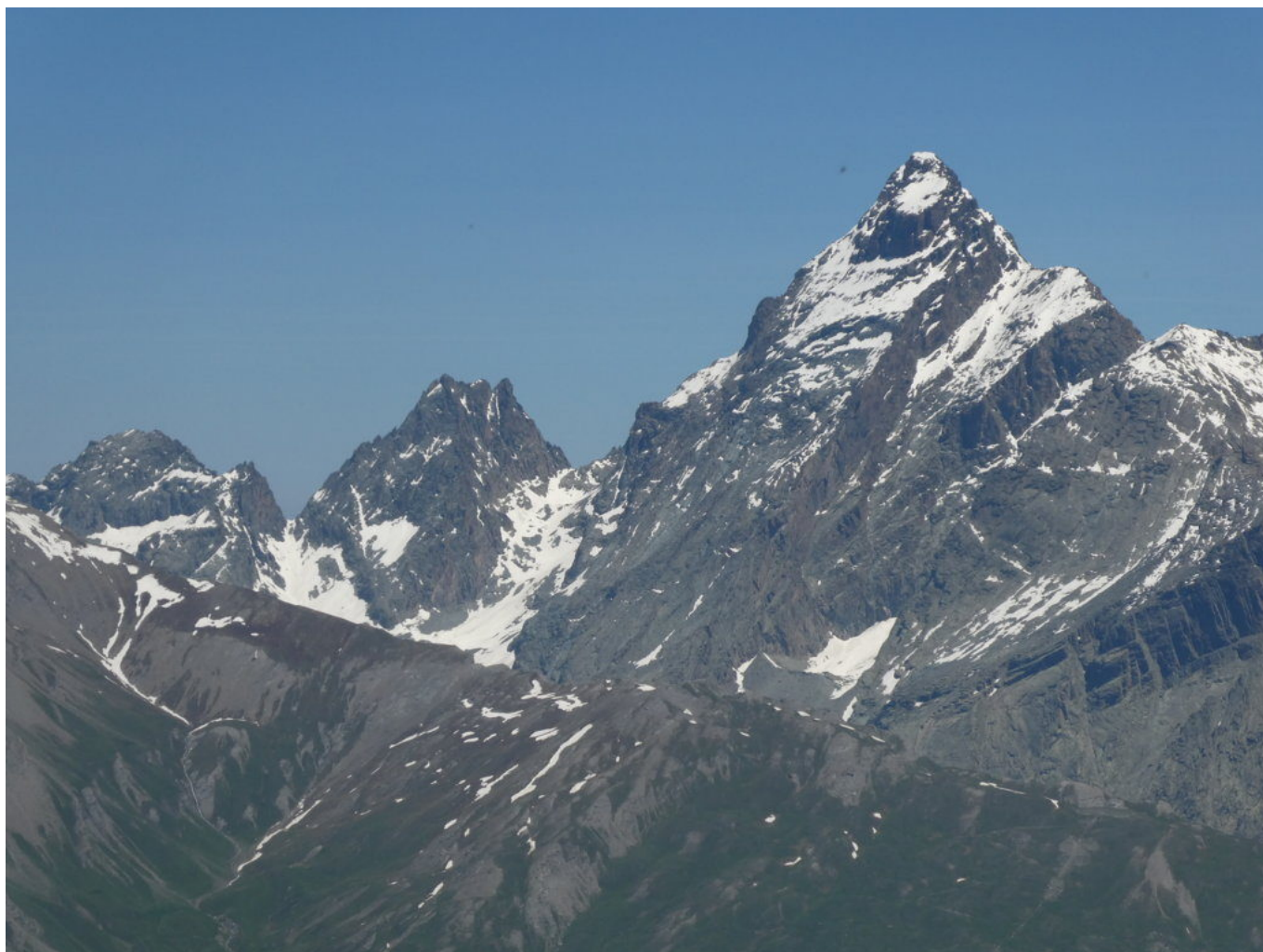
Punta Gastaldi, Vsolotto e Monviso

Bello il panorama sul Monviso e sul Visolotto e la Punta Gastaldi poste a sinistra.