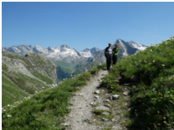
Luca e Caterina