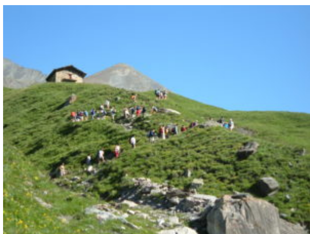
Prima baita verso il Passo di Fiutrusa

Si supera un ponte per inoltrarsi nel Vallone Varaita di Rui, uno strappo porta fino alle prime grange,