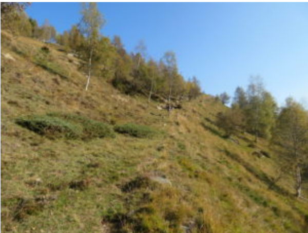
Diagonale verso destra

Si prosegue la salita sulla sterrata e poco dopo si fa un taglio in diagonale verso destra su sentiero (V8).