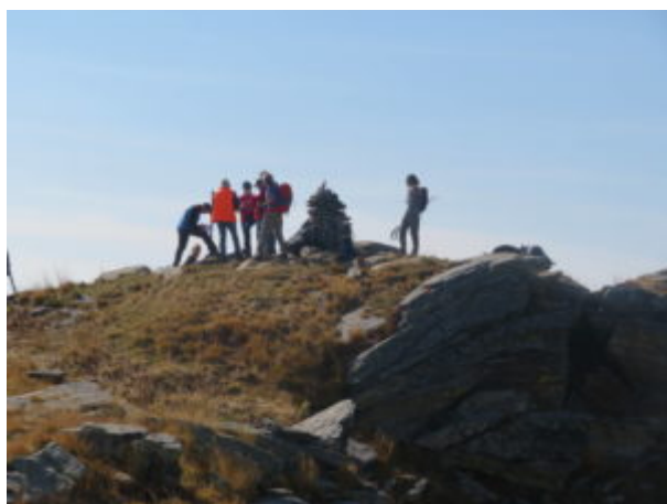
Ostanetta, gruppo intento a risistemare la croce