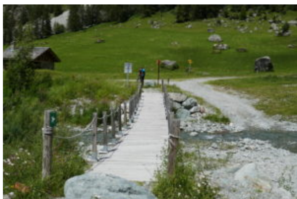
Ponte vicino al parcheggio

Dal parcheggio in breve si raggiunge un ponte in legno e si attraversa il Ponthurin.