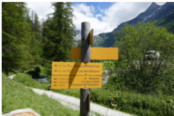
Cartello per il Refuge du Mont Pourri

Quindi, raggiunto l'abitato, si prende subito a destra una strada che sale decisa, è presente un cartello indicatore.