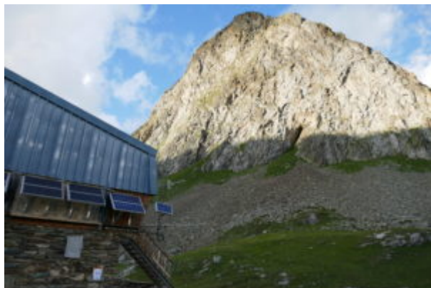
Refuge du Mont Pourri