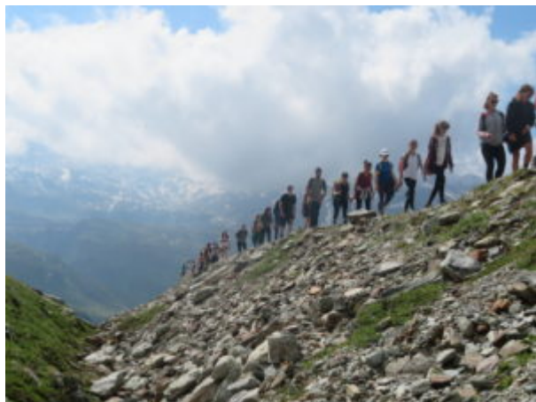
In gita verso il rifugio

Si sale su costoni erbosi, morene, si passa in valloncelli, sotto la bastionata rocciosa delle Grandes Murailles, con vista sul ghiacciaio del Mont Tabel e di Cherillon.