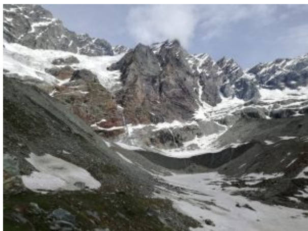
Ghiacciaio del Tabel

Si sale su costoni erbosi, morene, si passa in valloncelli, sotto la bastionata rocciosa delle Grandes Murailles, con vista sul ghiacciaio del Mont Tabel e di Cherillon.