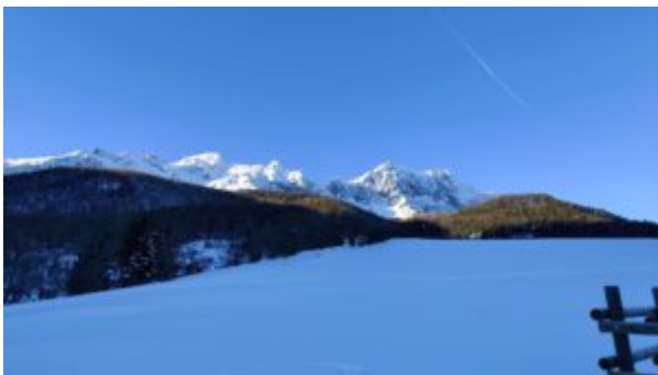
Grand Hoche dal parcheggio di Château

Lasciata l'auto si prosegue lungo la strada per qualche centinaio di metri fino ad incontrare la traccia (se presente) che punta verso l'alto sull'ampia radura innevata in direzione della Grand'Hoche.