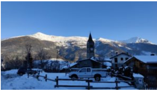
Parcheggio di Château

Il presente itinerario inizia dal parcheggio alto di Château ma, se le condizioni della neve lo consentono, è possibile partire dal campeggio di Beaulard.