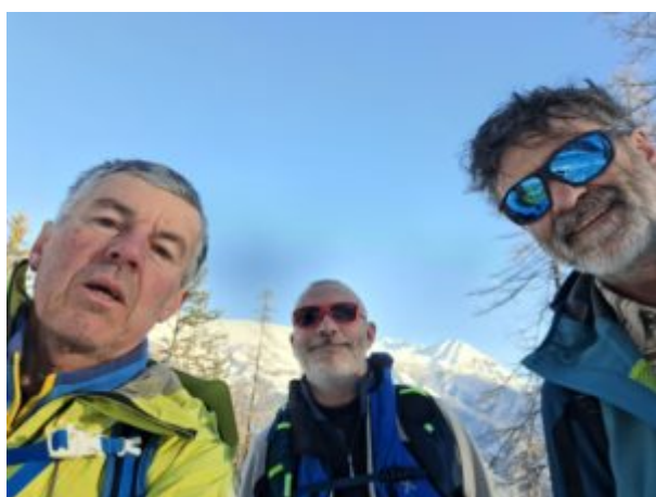
Noi in cima

fino a vedere in alto il gabbiotto dove terminavano gli impianti di risalita.