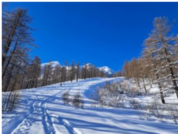
Parte alta del tragitto

Si prosegue verso l'alto su evidente pista disboscata