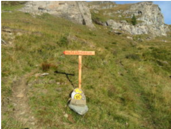
Deviazione per la Testa Grigia

Si flette leggermente a sinistra lasciando l'alpeggio e si continua a salire con un traverso in direzione della bastionata rocciosa che è solcata da una cascata. In questo tratto ci sono meno indicazioni, si incontrano due piccoli torrenti e il sentiero n. 10c per il Colletto della Testa Grigia.