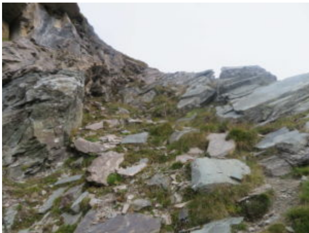
Tratto con catene

Quindi si giunge ai piedi del risalto e si piega a sinistra sulla traccia, arrivando prima ad una erbosa cengia e poi a placche rocciose, dove si trova l'unico tratto attrezzato con catene. (Utile in particolare per la discesa con terreno bagnato).