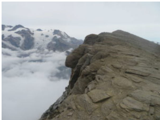
Cresta finale Piccolo Rothorn