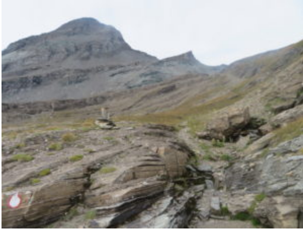
Conca sotto la Testa Grigia

Sulla destra un caratteristico “fungo” di roccia con alle spalle la costiera orografica sinistra della Valle del Lys con la Punta Straling, il Corno Grosso, il Corno Bianco, la Cima della Compagnia e la Punta di Rissuolo.