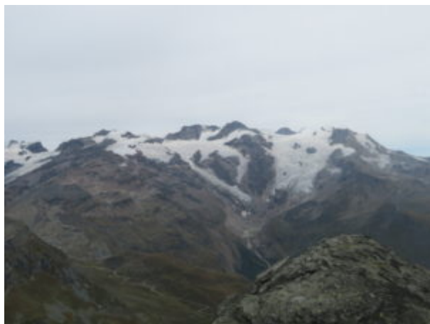
Cime del Monte Rosa

sui Lyskamm e tutte le altre punte tra cui Parrot, Piramide Vincent e Punta Giordani.