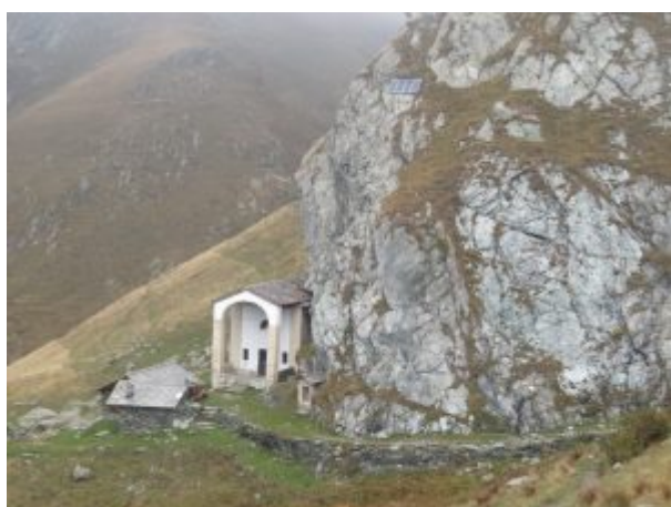
Santuario di San Besso visto dall'alto