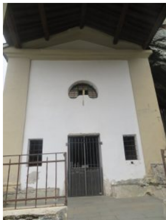
Santuario di San Besso