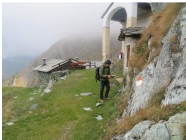
Giorgio al Santuario

Si può aggirare il Monte Fautenio (chiamato anche Fauterio o Fanton) salendo in cima per un esile sentiero (porre attenzione con neve e ghiaccio, un po' esposto) fino alla croce con cappelletta, 2072 m.