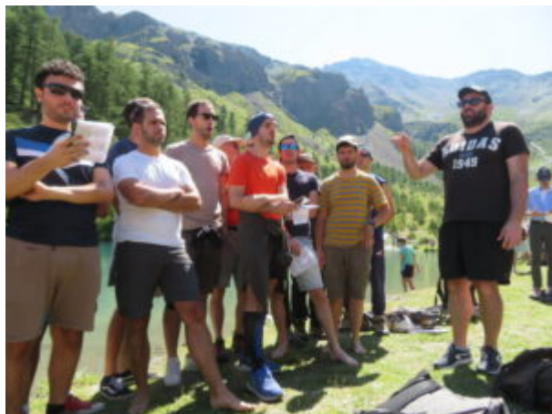
Cantando ai bordi del lago

Si può raggiungere la meta anche con percorso su strada sterrata.