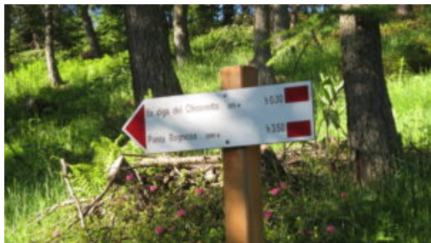
Cartello per ex diga del Chisonetto