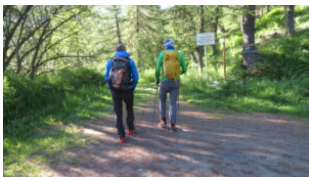
Alla ex-diga del Chisonetto per il Sentiero dei Rododendri

Un bel cartello indica la deviazione. Si va a sinistra lasciando la strada sterrata.