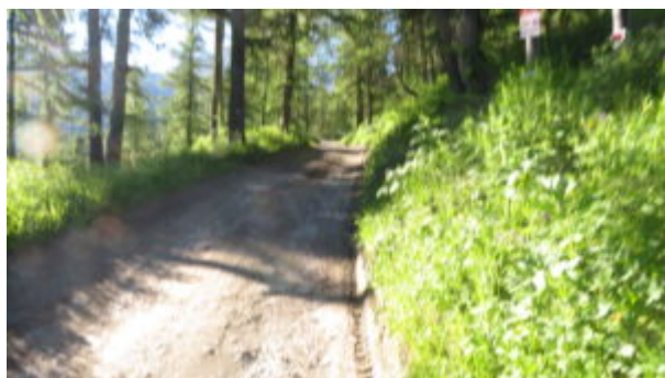
Strada verso la Diga del Chisonetto

Dal piazzale Kandahar, al fondo verso Pragelato, si sale per una strada sterrata in direzione sud. Si passa a lato di una costruzione posta a sinistra mentre a destra ci sono i campi da golf.