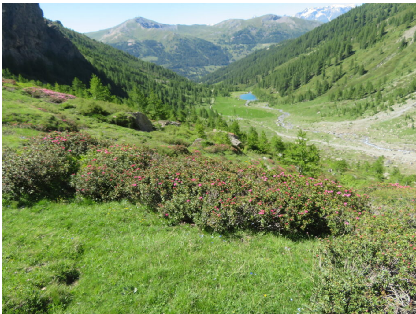
La conca della ex diga del Chisonetto dall'alto

Si può raggiungere la meta anche con percorso su strada sterrata.