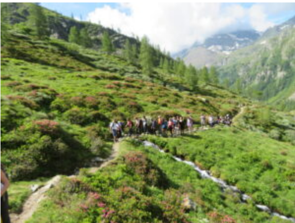
A lato macchie di rododendri