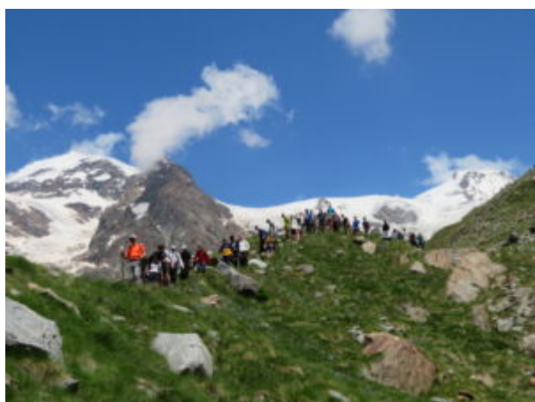
Scendendo dalle Sorgenti del Lys

prestare attenzione particolare sia dove ci sono le corde sia all'inizio della morena.