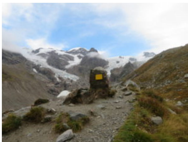
Cippo sopra le sorgenti del Lys

In prossimità di un cippo si lascia la deviazione a destra, (poco evidente) che prosegue verso un altro belvedere e si continua verso sinistra; poi con decisione a destra per un breve tratto e si raggiunge un cippo, il punto panoramico che è la nostra meta.