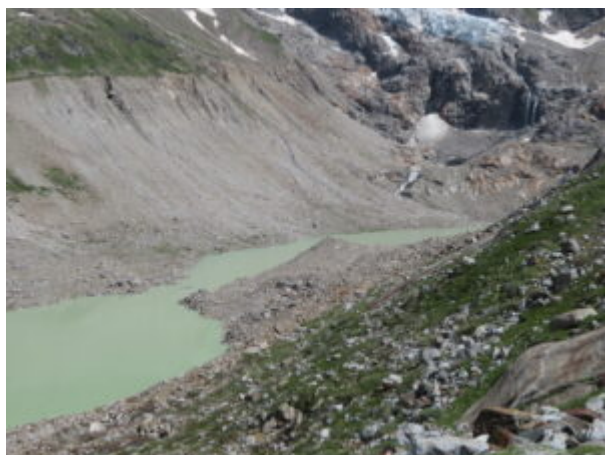
Vista sul lago glaciale

prestare attenzione particolare sia dove ci sono le corde sia all'inizio della morena.