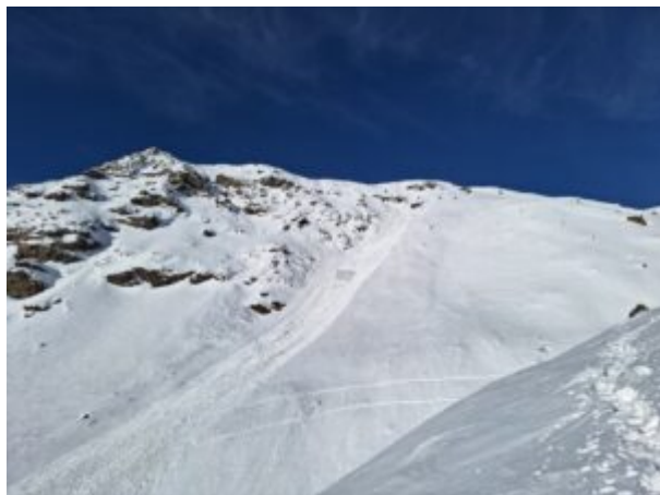
Slavina dal Truc Battaglie

Per questo siamo saliti dal lato delle Rocce Losere, seguendo la traccia di alcuni ciaspolatori che ci precedevano. Più in alto ci si sposta verso sinistra avvicinandosi alla parte centrale del vallone.